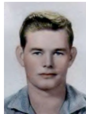
A Robert Fuller se le extrajo la sangre antes de fusilarlo el 16/10/1960.

Un ex preso político cubano que estuvo encarcelado de 1963 a 1968 en la prisión de Boniato, en Santiago de Cuba, declaró a Archivo Cuba: “En 1963, éramos unos 5.000 presos políticos en Boniato. Cada madrugada, traían a dos o tres condenados que iban rumbo al paredón de fusilamiento a una zona especial del hospital de la prisión donde a puertas cerradas les sacaban la sangre. Como soy inválido, me mantenían allí, en lo que llamaban “el hospitalito.” Aunque no nos dejaban ver a las víctimas, yo estaba a unos 20 metros de esa habitación y podía oír todo. Se lo hicieron a todos los que iban a fusilar”. 27